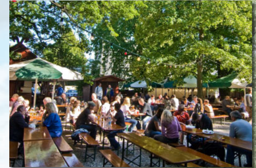
Wijn & Bierfeste